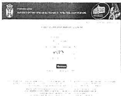
Branko Trajković uvid u spisak.jpg 346K